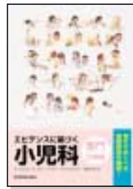
専門診療編 定価4,830円(税込)