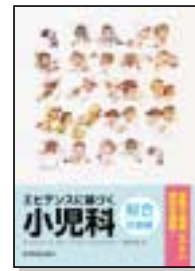
総合診療編 定価4,935円(税込)